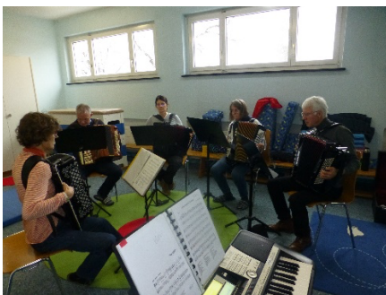
Mitglieder des HCS unterstützen die Wiedereinsteigerin