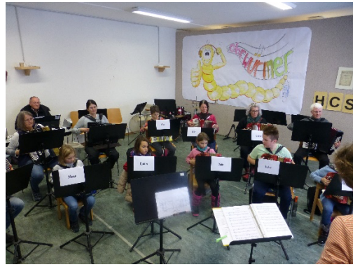
Hauptprobe nach dem Mittagessen mit einigen Mitgliedern des HC Schaan