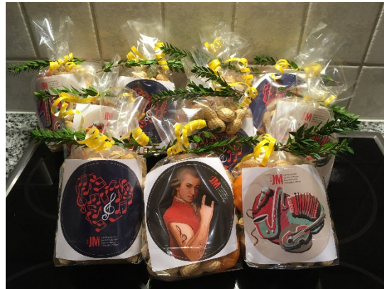
Klaussäckli als Dankeschön