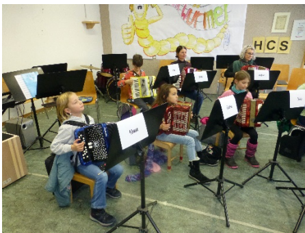
Probe in den Räumlichkeiten des