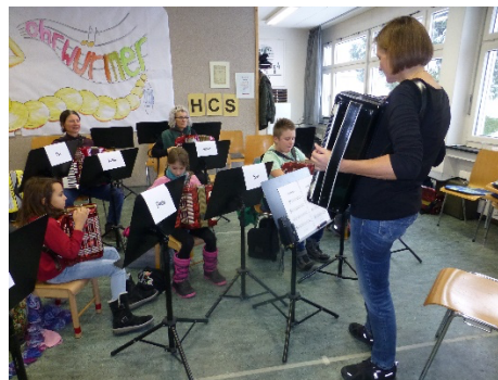
Handharmonika Clubs Schaan