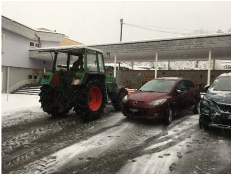
Schneeräumung vor der Ankunft der Teilnehmenden