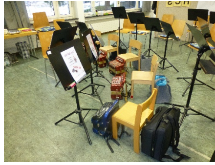
Alles steht für die Teilnehmenden bereit.