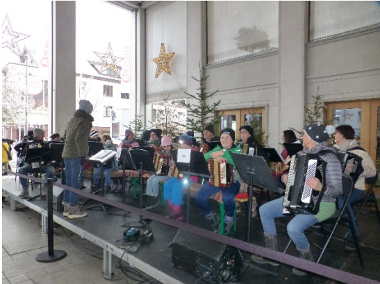
Aufführung am Klausmarkt